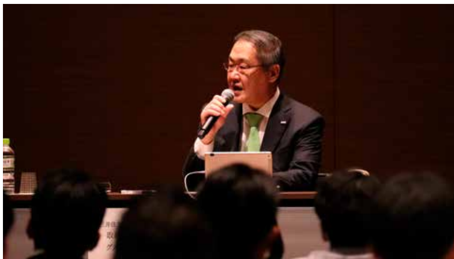
新中期経営計画策定に向けた社内セミナーの様子

また、新たにマテリアリティと定めた「DE&I (Diversity, Equity & Inclusion)・人権」は、成長戦略そのものです。SMBCグループでは、日本および38の国と地域で、多様性に富む11万人以上の従業員が働いています。お互いを尊重しながら働くことが我々の競争力につながり、豊かな個性とさまざまな価値観のぶつかり合いから未来のイノベーションが生まれます。2023年4月には、多様でプロフェッショナルな従業員が、挑戦し続け、働きがいを感じる職場の実現を目指すための旗印として、「SMBCグループ人財ポリシー」を制定しました。従業員と企業が、ミッション、ビジョン、バリューを共有し、相互にコミットすることで、グループ・グローバルベースの人材力を高めていきます。