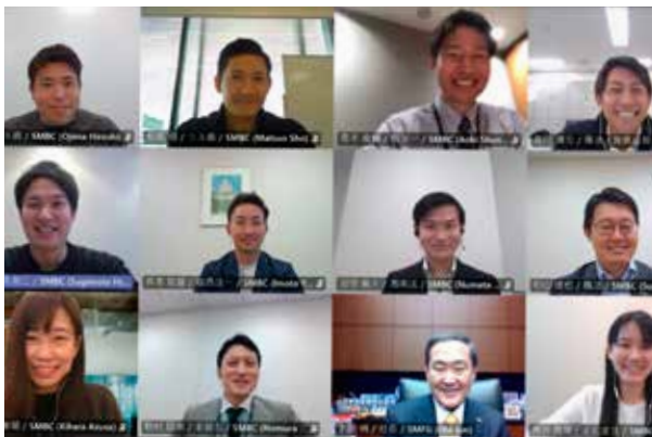
従業員が企画したグループCEOとの意見交換会