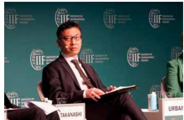
2023 IIF Sustainable Finance Summit