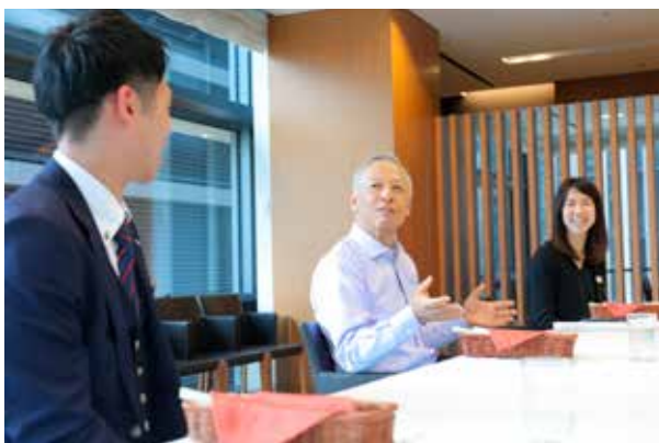
「Huddle福留」（三井住友銀行における頭取との交流イベント）