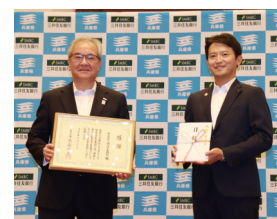
兵庫県 / 齋藤知事との記者会見の様子

このようにSMBCグループでは、グループの総合力を活かし、引き続き地域経済の活性化に貢献していきます。