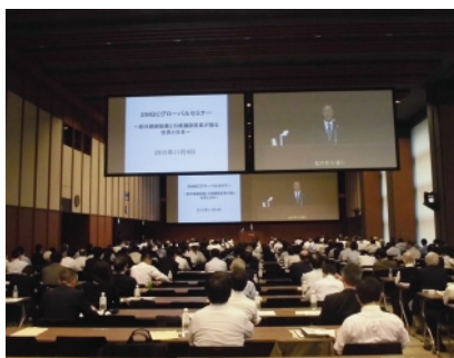
日経・日興セミナー

また、すでに海外展開をされているお客さまには、事業拡大や再編等のニーズに対し、国内外関連部門と協働した質の高いソリューションの提供を行っています。さらに、貿易取引に関する各種アドバイスや実務セミナーを通じて、お客さまの外国為替取引全般に対するサポートを実施しています。