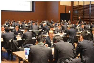
シニアビジネスマッチング

お客さまの販路拡大ニーズや協業ニーズ等にお応えするため、2015年度は年間1万件以上のビジネスマッチング(業務斡旋)を行いました。また、「インバウンド」「シニアビジネス」等の企業の関心の高い旬な切り口をテーマとした大規模ビジネスマッチングを開催し、参加した多数の企業から高い評価をいただきました。