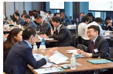
SMBCインバウンドビジネスマッチング