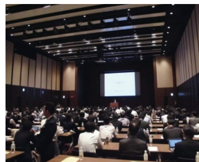
東南アジア現法管理セミナー