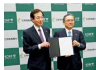
「神戸市と株式会社三井住友銀行との産業振興にかかる連携協力に関する協定」締結の様子

全国の地方自治体および地域金融機関等と連携・協力し、SMFGのネットワークを活用して、地域経済に貢献すべく地方創生に取り組んでいきます。