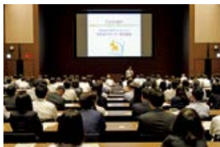
認知症サポーター養成講座の様子

SMFGでは、2017年3月末までに約10,000名の認知症サポーターを育成しました。そのほか、三井住友銀行ではサービス・ケア・アテンダントの資格取得も推進しており、高齢者や障がい者の方も安心してご利用いただける店舗づくりを進めています。