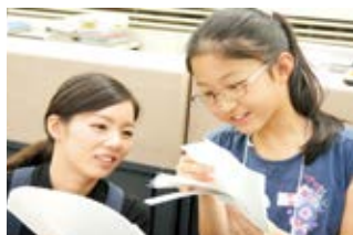
夏休みに実施する小学生の銀行業務体験