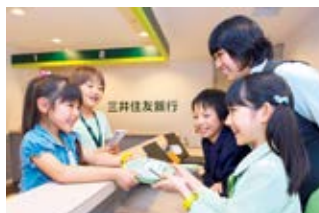
キッザニアにおける銀行業務体験