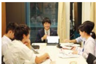
福島県いわき市と協働した キャリア教育「いわき志塾」

そのほか、小学生向け書籍「銀行のひみつ」や、第10回キッズデザイン賞「優秀賞 消費者担当大臣賞」を受賞した、子ども向け環境情報誌「JUNIOR SAFE」の発刊、親子で収支管理を学ぶ、おこづかい帳アプリ「ハロまね」、お仕事体験タウン「キッザニア」への協賛、中学生向けの経済教育プログラム「ファイナンスパーク」への協力等、各種教材の提供や施設への出展を通じた金融リテラシー教育を行っています。