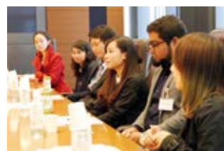
留学生による研究発表会の様子

三井住友銀行国際協力財団は、新興国の経済発展に資する人材の育成および国際交流を目的に、アジアから日本の大学院へ進学した留学生に対して奨学金を支給しています。また、新興国の経済発展に資する活動を行う研究機関・研究者への助成も行っています。