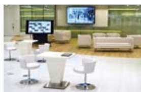
リニューアルした銀座支店

SMFGでは電力等のエネルギー使用量削減について毎年度目標を設定し、積極的に取り組んでいるほか、2016年度からは、環境データに関する第三者保証を取得しました。そのほか、三井住友銀行では通帳のウェブ化や融資書類の電子化、三井住友カードでは支払明細書の電子化を通じた環境負荷軽減につながる取組も推進しており、その取組の一環として、2017年4月には、三井住友銀行の銀座支店をリニューアルし、複合施設GINZA SIX内に各種手続のペーパーレス化を実現した次世代型の店舗をオープンしました。