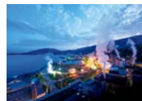
再生可能エネルギー活用支援

SMFGでは、環境ビジネスを本業を通じた地球環境の維持・改善に貢献するための取組と位置付けています。たとえば、新興国における環境インフラ整備案件や、再生可能エネルギーに関する案件のサポート等、各社が連携して業態に応じた支援を実施しています。また、環境投資の促進という観点では、グリーンボンドの発行やエコファンド等の販売を推進しています。お客さまに向けた情報発信としては、環境情報誌「SAFE」の発行や、環境展示会「エコプロ展」への出展を通じて、様々な情報提供に努めています。