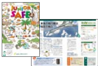
子ども向け環境情報誌 「JUNIOR SAFE」