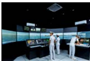
最新の航海シミュレーターによる訓練

また、2015年7月、三井住友銀行はミャンマーにおける小中学校教員研修プログラムに関する覚書を日本企業として初めて日本ユニセフ協会と締結しました。同プログラムを通じ、同国の発展に貢献していきます。