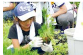
被災地でのボランティア活動

2011年5月より、SMFGの従業員およびその家族による東日本大震災の被災地支援ボランティアを行っており、2016年度には従業員による熊本地震の被災地ボランティアも行いました。2017年3月末時点で、東北と熊本のボランティア活動には延べ1,000名を超える役職員とその家族が参加しています。