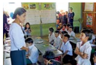
ミャンマーでの教育支援活動の様子