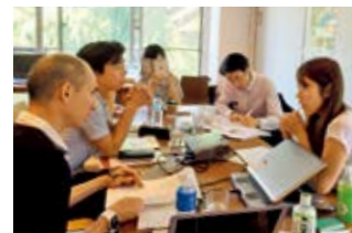
従業員のスキルを活用したプロボノ活動

また、SMFGでは従業員が参加できるボランティア活動プログラムを実施しているほか、従業員の知識や保有スキルを活用したプロボノ活動「SMFGプロボノ・プロジェクト」を実施しました。