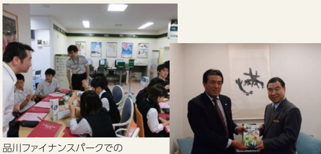
品川ファイナンスパークでの 中学生学習支援

三井住友銀行・SMBC日興証券では、小学生向けの職業体験イベントを開催しています。三井住友銀行では、「夏休み！子ども銀行たんけん隊」に加えて、各支店で随時小学生から高校生まで職場見学の受け入れを行っているほか、小学生向け書籍「銀行のひみつ」の発刊、お仕事体験タウン「キザニア」への協賛、中学生向けの経済教育プログラム「品川ファイナンスパーク」への協力など、幅広く金融経済教育活動に取り組んでいます。SMBCコンシューマーファイナンスでは、主にお客さまサービスプラザが中心となり、小学生を対象にお金の成り立ちや役割について学ぶ「カードゲーム」や、学生・社会人を対象とした金融にかかわるセミナーを実施しており、2012年度は、合計2,137回開催しました。関西アーバン銀行では、小学生を対象とした「銀行見学会」を夏休みに開催しており、中学生を対象とした「職場体験学習」の受け入れも実施しています。三井住友銀行・三井住友ファイナンス&リース・SMBC日興証券・三井住友カード・日本総合研究所・みなと銀行では、大学への講師派遣等も行っています。