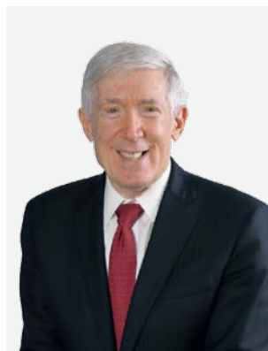
Dr. Robert D. Hormats