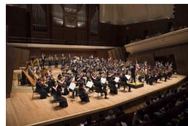
新日本フィルハーモニー