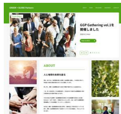
ウェブサイトイメージ

SMBCグループの知見を結集したさまざまなかつ有益な情報発信をはじめ、お客さまとともに課題解決に向けて一丸となって取り組むことを目指します。