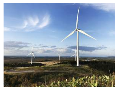
天北ウインドファーム