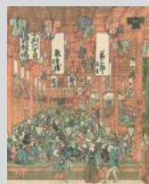
浮絵駿河町呉服屋図 (公益財団法人三井文庫所蔵)