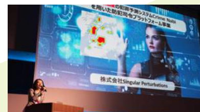
ピッチコンテストの様子