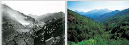
左:明治14年別子銅山全景(旧製錬吹火之図)(住友史料館所蔵) 右:現在の別子銅山全景(住友林業株式会社所蔵)