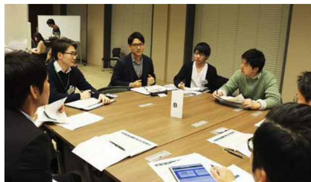
新中期経営計画策定に向けたディスカッション

さらに、三井住友銀行では、国内外の全従業員を対象とするビジネスアイデアコンテスト「SMBC Pitch Contest」を開催し、従業員が経営陣に対して直接プレゼンテーションを行う機会を設けています。これまで優秀賞を受賞したビジネスアイデアから、新たな商品・サービスが生まれています。