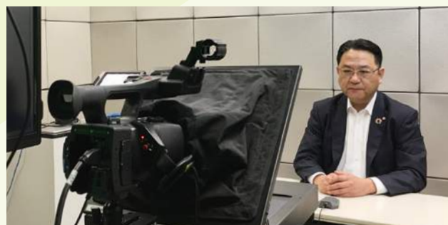
従業員へのビデオメッセージ (SMBC日興証券)