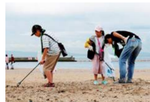
須磨海岸における清掃活動

各地で行っている復興支援活動や清掃活動には、グループ各社の役職員やその家族が参加しているほか、従業員がプロボノ活動へ参加することで各種NPOと連携し、社会課題の解決に向けて取り組んでいます。