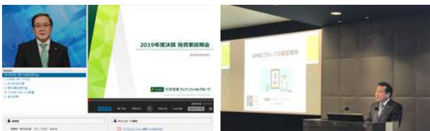
投資家説明会におけるプレゼン動画配信

なお、新型コロナウイルスの影響下においても、2020年5月の投資家説明会でインターネットによるCEOプレゼン動画の配信と電話会議形式での質疑応答を併用する等、ディスクロージャーの質を落とさない取組を行っています。