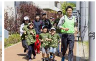
地域交流を目的としたランニングイベント