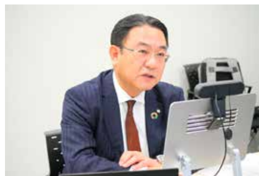
社長表彰式の様子 (SMBC日興証券)