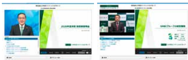
投資家説明会におけるプレゼン動画配信

なお、コロナ禍においても、各種説明会や投資家との個別面談は非対面の形式で実施する等、安全に配慮しながらもディスクロージャーの質を落とさない取組を行っています。