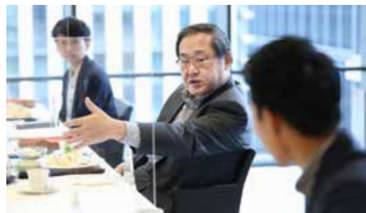
「カタリバ2020」ランチミーティング

また、コロナ禍においても、タウンホールミーティングや、社内コンテストの表彰式等の場を活用し、経営陣が現場の従業員と直接コミュニケーションを行いました。