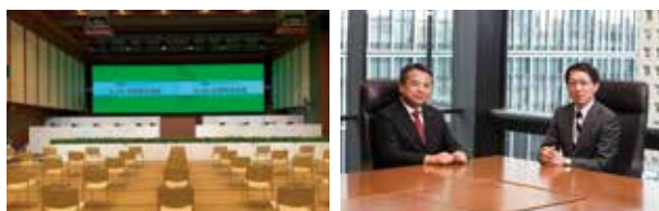
第19期定時株主総会