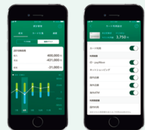
リニューアルしたモバイルアプリ

「便利」「安心・安全」「お得」を3本の柱として、新しいキャッシュレス決済エクスペリエンスを実現します。2018年度は、三井住友銀行・三井住友カードのモバイルアプリをリニューアルし、デビットカードの支払限度額の設定や他行口座を含む資産管理機能等を追加しました。