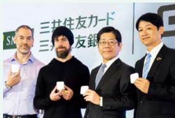
Square社との合同記者会見

中小事業者・個人事業主向けのスマートフォンを利用したカード決済サービス「Square」の推進により、2019年10月よりスタートする政府の「キャッシュレス・消費者還元事業」も見据え、加盟店の裾野拡大を加速していきます。Squareについては、三井住友銀行の全支店での取扱も開始しています。