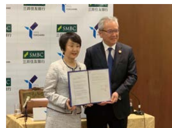
「SDGs 未来都市・横浜の実現に向けた連携協定」締結の様子

引き続き全国の地方自治体および地域金融機関等と連携・協力し、SMBCグループのネットワークを活用して、地域経済に貢献すべく地方創生に取り組んでいきます。