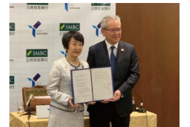
「SDGs 未来都市・横浜の実現に向けた連携協定」締結の様子

引き続き全国の地方自治体および地域金融機関等と連携・協力し、SMBCグループのネットワークを活用して、地域経済に貢献すべく地方創生に取り組んでいきます。