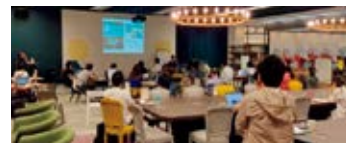
hoops link kobe

そのほか、引き続き全国の地方自治体および地域金融機関などと連携・協力し、SMBCグループのネットワークを活用を通じて、地域経済に貢献すべく地方創生に取り組んでいきます。