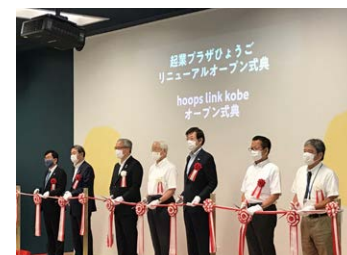
2020年9月、イノベーション施設「hoops link kobe」を神戸本部内に開設、自治体と連携しスタートアップ支援施設を誘致

引き続き全国の地方自治体および地域金融機関等と連携・協力し、SMBCグループのネットワークを活用して、地域経済に貢献すべく地方創生に取り組んでいきます。