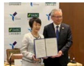
「SDGs未来都市・横浜の実現に向けた連携協定」締結式の様子

そのほか、引き続き全国の地方自治体および地域金融機関等と連携・協力し、SMBCグループのネットワークを活用を通じて、地域経済に貢献すべく地方創生に取り組んでいきます。