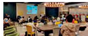
hoops link kobe

SMBCグループは、全国の事業者、地方自治体および地域金融機関等と連携・協力し、キャッシュレス、業務効率化、リモートワーク等を地方における先導的なデジタル化の取組として支援し、引き続き、地域経済に貢献すべく地方創生に取り組んでいきます。