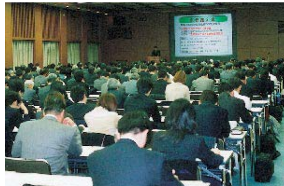
(SMBC大手町本部でのセミナー風景)

平成15年3月4日に各社のお客さま約500名に参加していただき、第1回SMFG「環境セミナー」を開催しました。