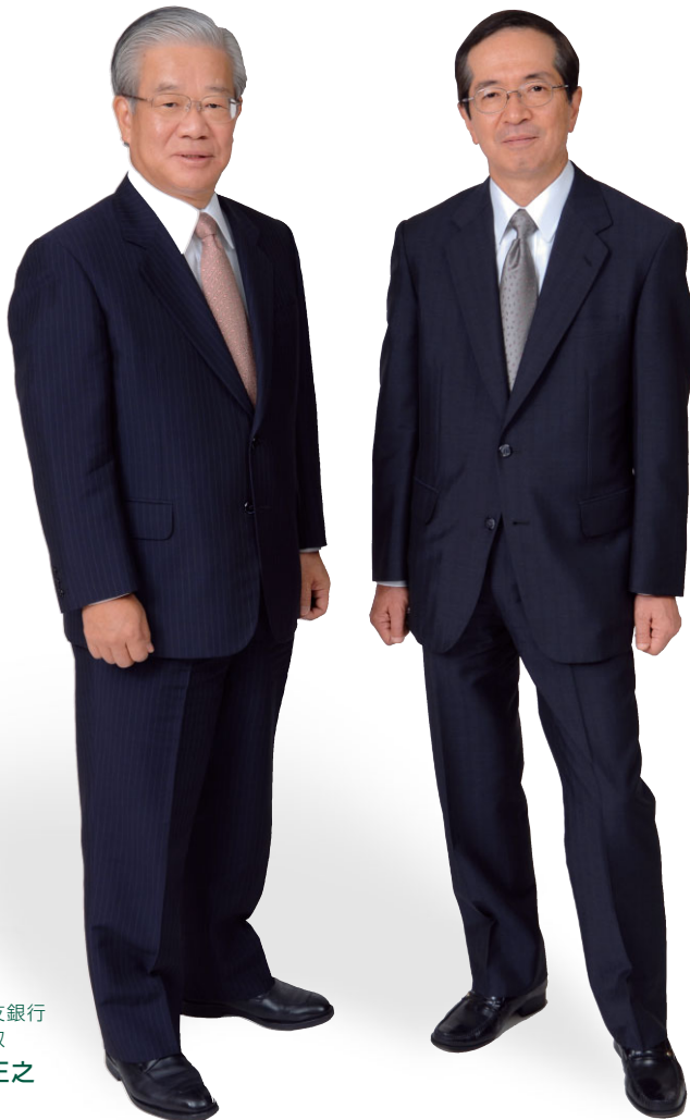
三井住友銀行 頭取 奥 正之