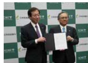
「神戸市と株式会社三井住友銀行との産業振興にかかる連携協力に関する協定」締結の様子

引き続き全国の地方自治体および地域金融機関等と連携・協力し、SMBCグループのネットワークを活用して、地域経済に貢献すべく地方創生に取り組んでいきます。