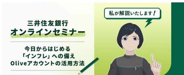
(オンラインセミナーでの活用)